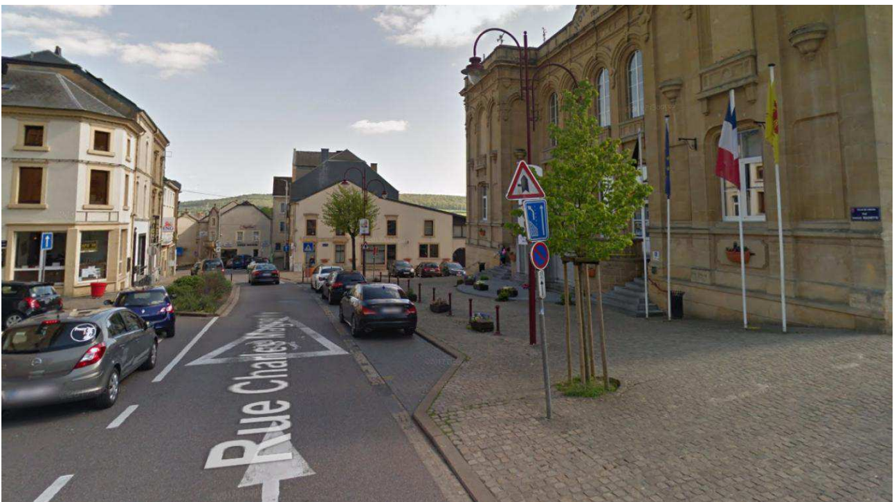
La conduite de la rue Charles Magnette dans un piteux état.

À partir de ce lundi, un important chantier va débuter dans l'une des artères principales du centre-ville de Virton. La rue Charles Magnette, située devant la mairie de Virton, sera fermée à la circulation pour une