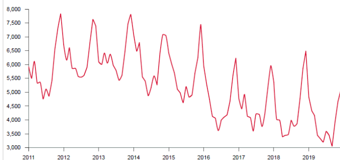
Nombre de délits enregistrés (figures criminelles) - national