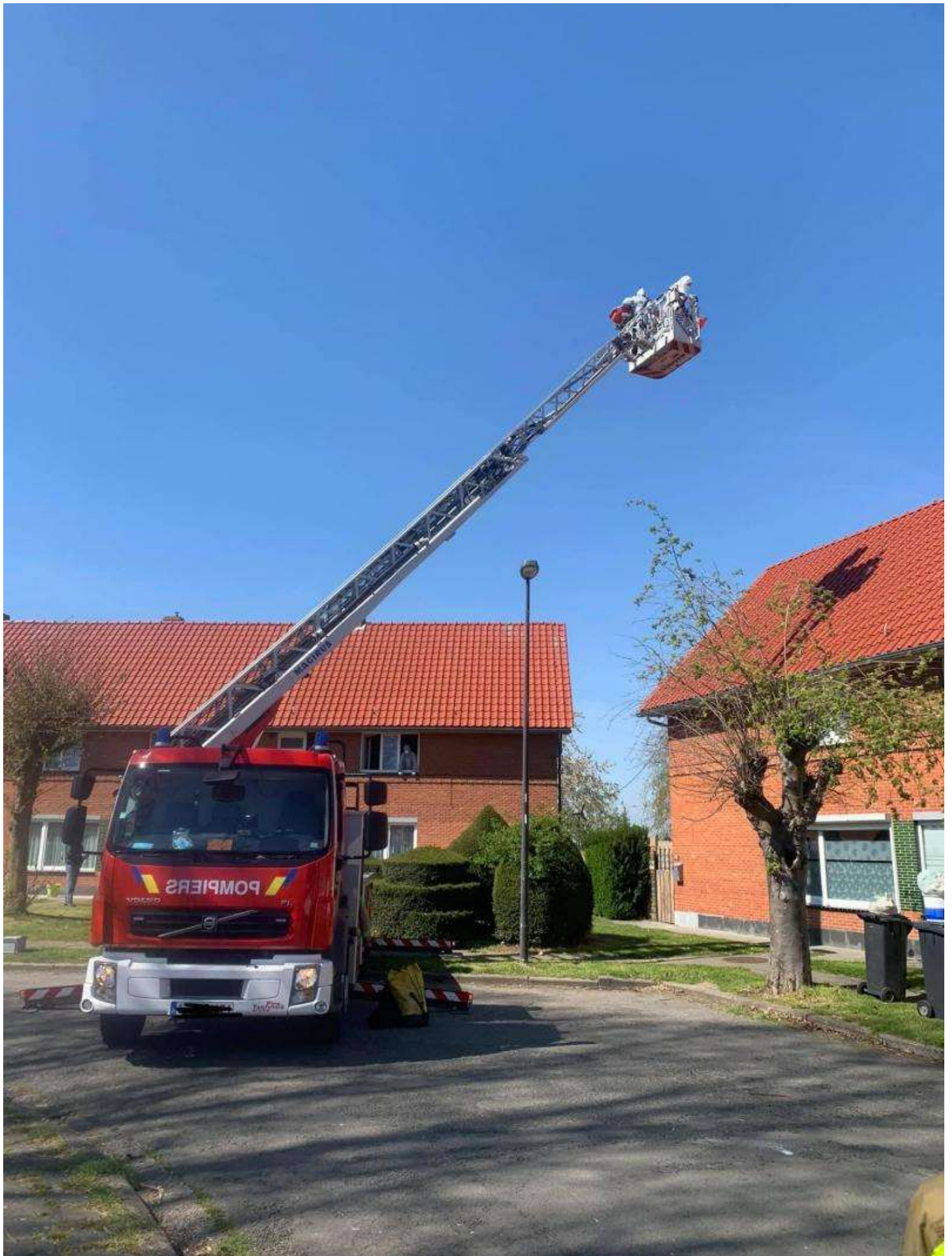
Ce lundi matin, l'auto-échelle de la caserne de Saint-Ghislain a été déployée pour évacuer une patiente. - Infos Centre de Secours de Dour