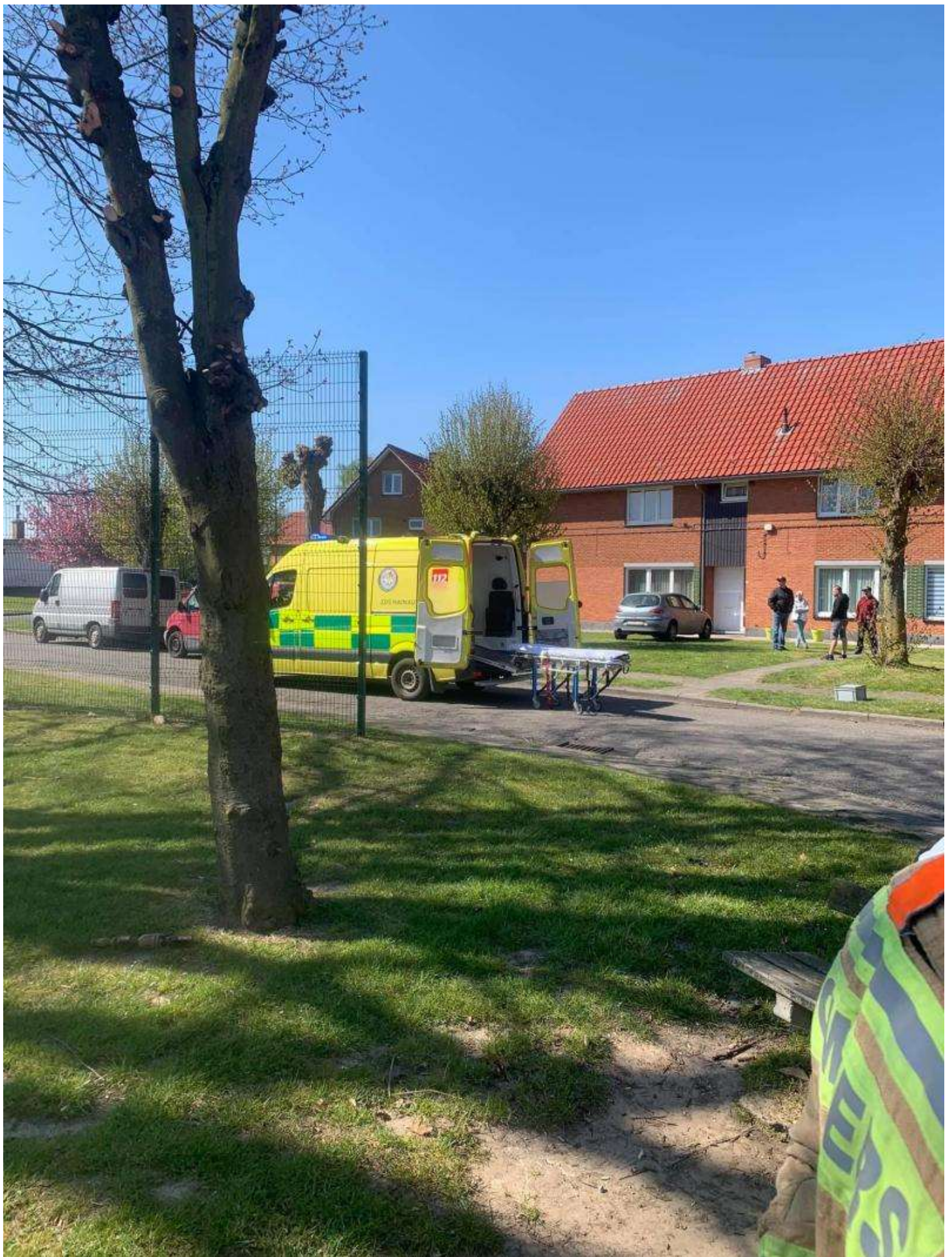
L'ambulance de la caserne de Quiévrain a été appelée. - Infos Centre de Secours de Dour