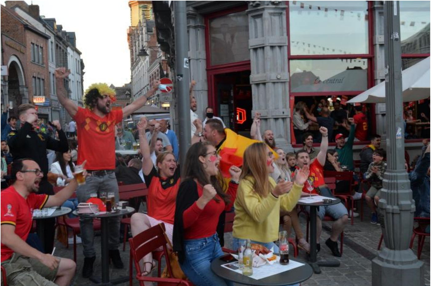
Les Diables ont fait lever leurs supporters dès le premier match.

À Mons, aucun arrêté pour interdire la circulation à certains endroits de la zone n'a été pris. Mais l'accès au centre-ville et les zones piétonnes seront toutefois bloqués grâce aux bornes dynamiques. Impossible donc d'aller klaxonner sur la Grand'Place par exemple.