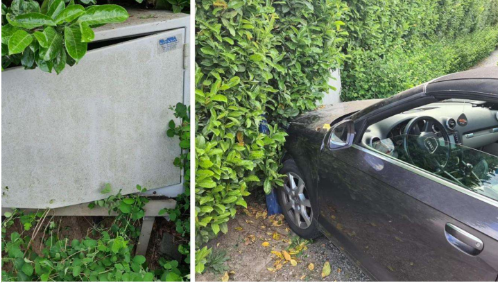
Un coffret de gaz a été touché dans l'accident. - Infos Centre de Secours de Dour