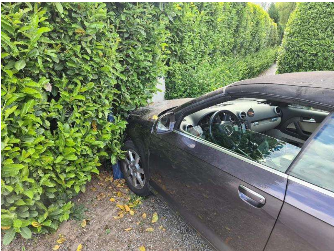
La conductrice a été percutée par l'arrière. - Infos Centre de Secours de Dour