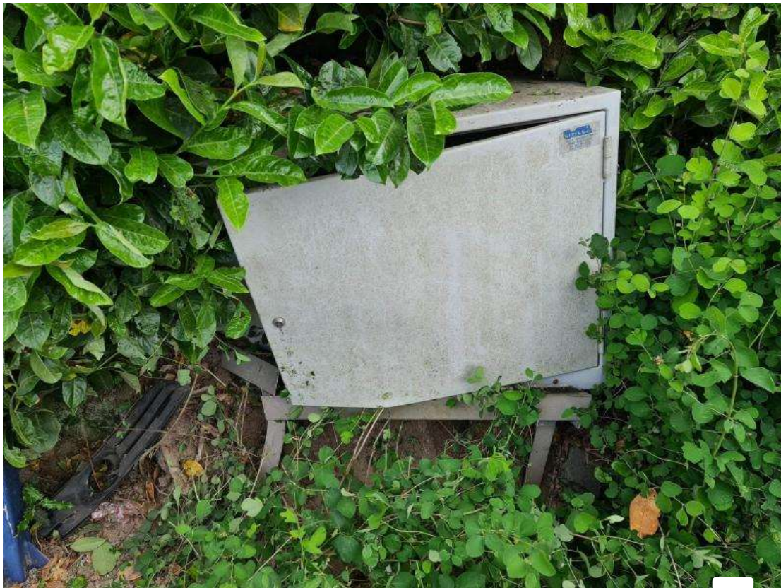
Le coffret de gaz a été touché. - Infos Centre de Secours de Dour