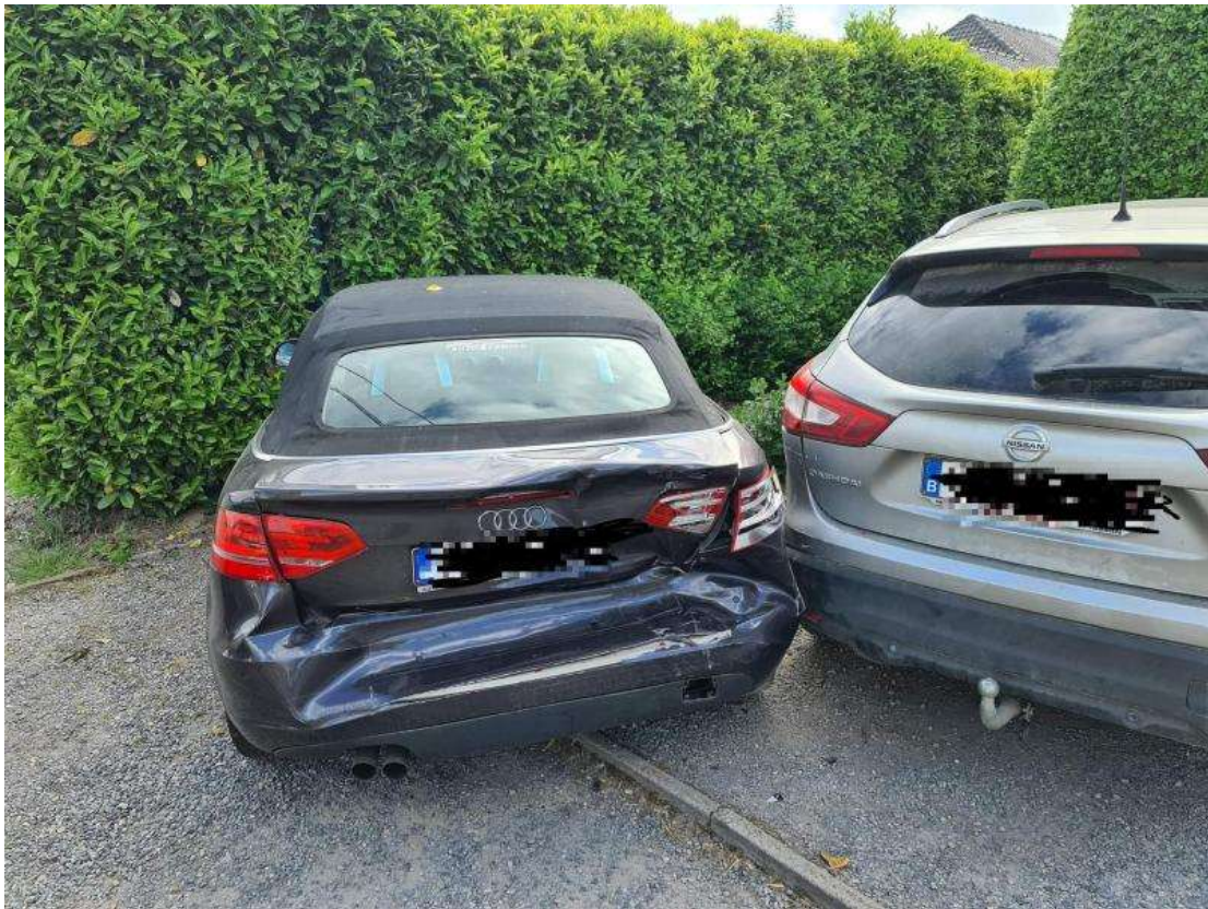
Deux voitures sont entrées en collision. - Infos Centre de Secours de Dour