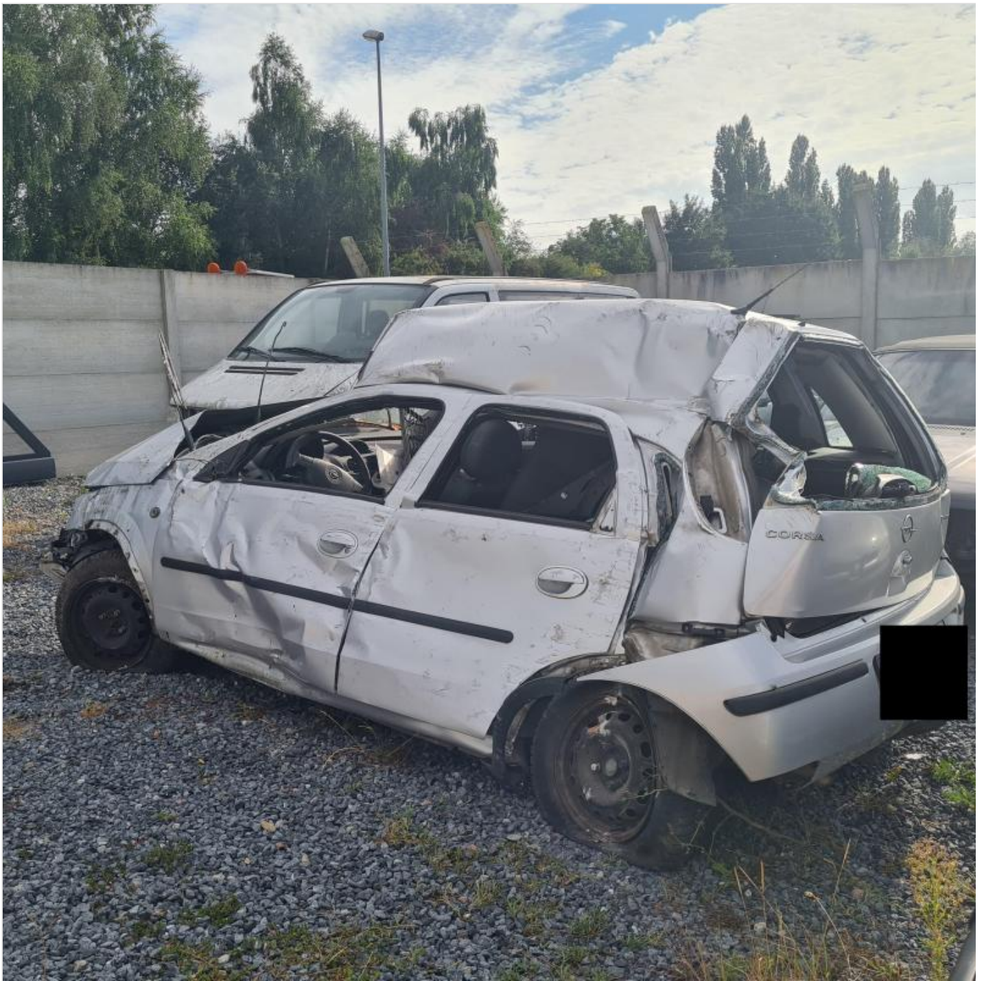
D'importants dégâts...