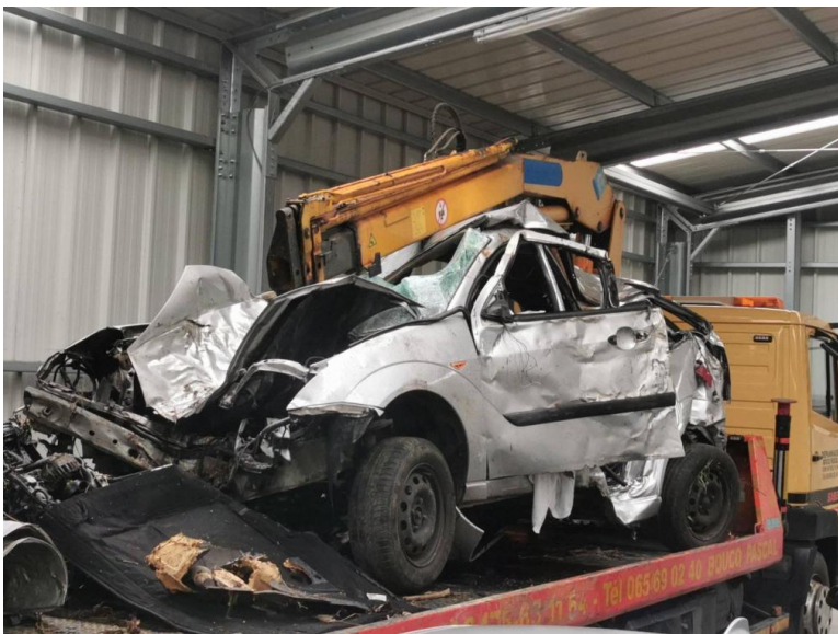
Les dégâts sont conséquents. - D.R.