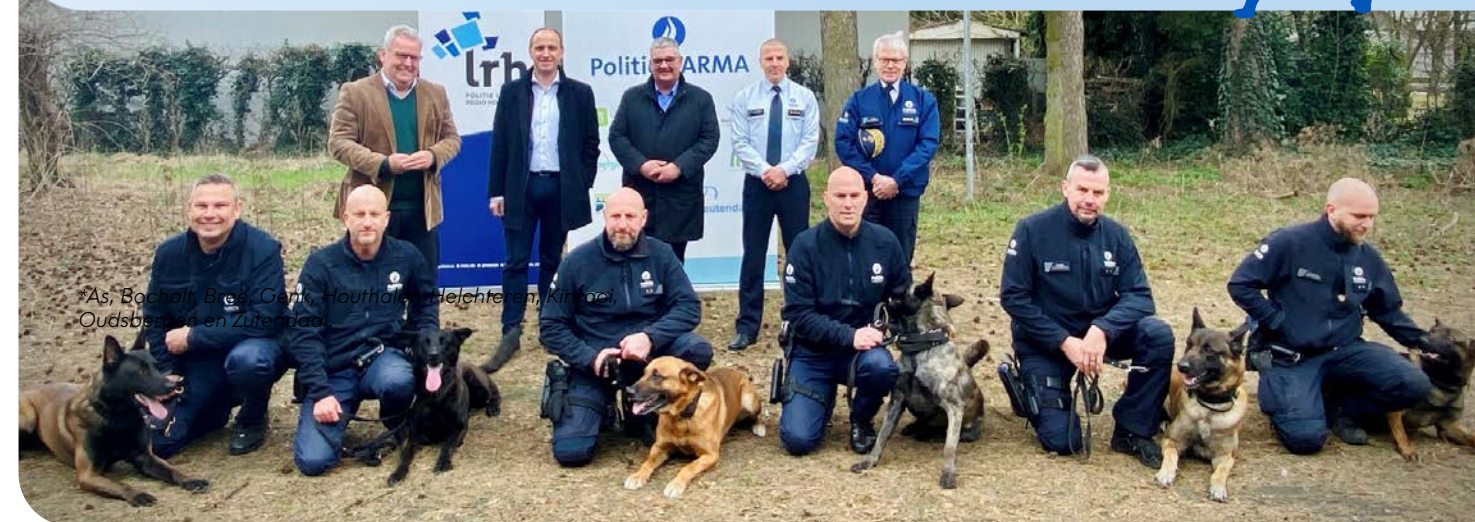
*As, Bocholt, Bree, Genk, Houthalen-Helchteren, Kinrooi, Oudsbergen en Zutendaal.

Onze hondengeleiders werken sinds kort samen met hun collega's van de politiezone CARMA*. Sinds enkele weken trainen de twee teams elke maand samen. Op die manier kunnen we van mekaar leren en expertise uitwisselen.